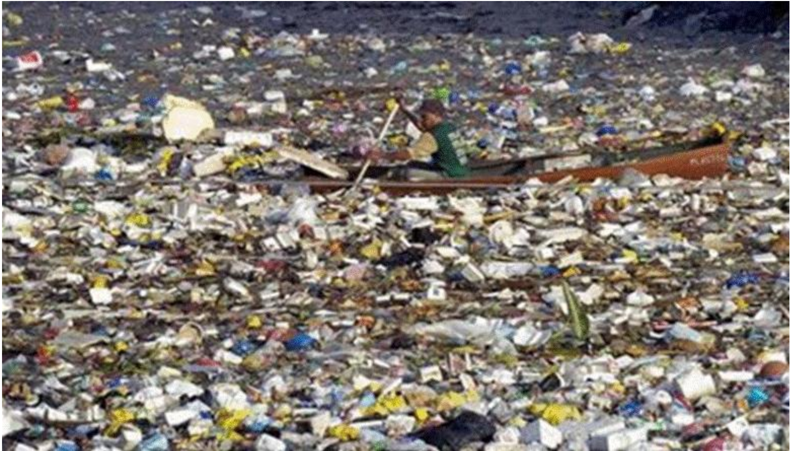
Foto genomen in de Stille Oceaan in 2004.